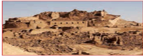
زمین لرزه یم : ساعت ۳۶ : ۵ دقیقه بامداد روز ۵ دی ماه ۱۳۸۲. ۶/۵ در مقیاس ریشتر